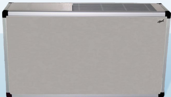
TGH - Edelstahl