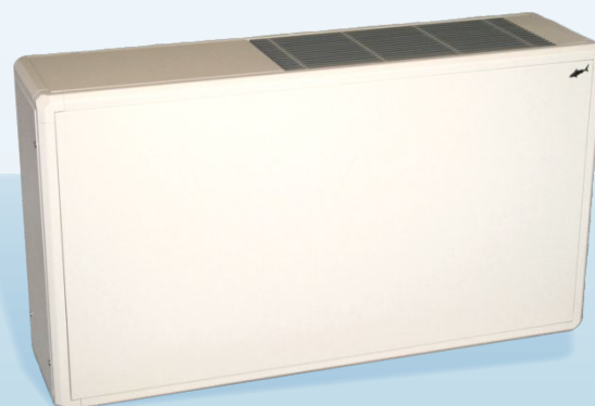
TGH - weiß (RAL 9010)